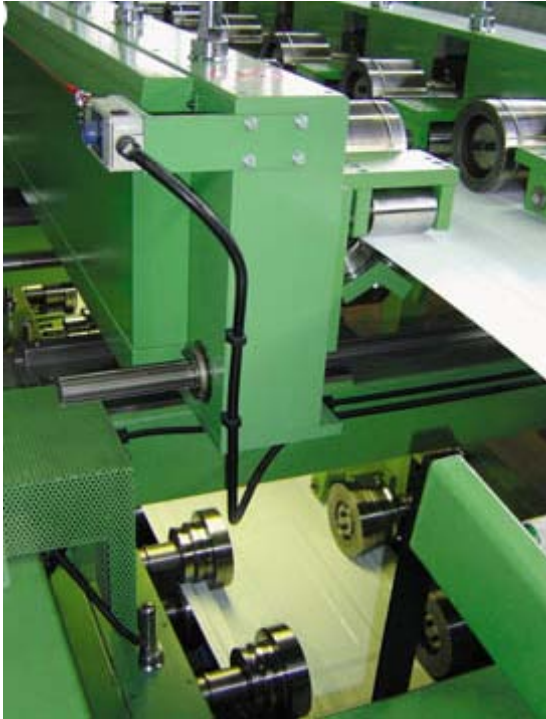
STROJ – mrtva kovina

Najprej pa vam povem dve resnični zgodbi.